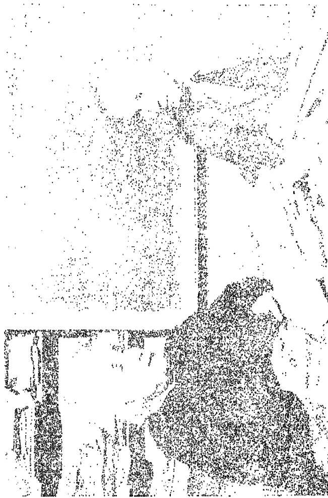
श्री अन्दाइन और श्रीपेनहाइमर, वैज्ञानिक परामर्श में